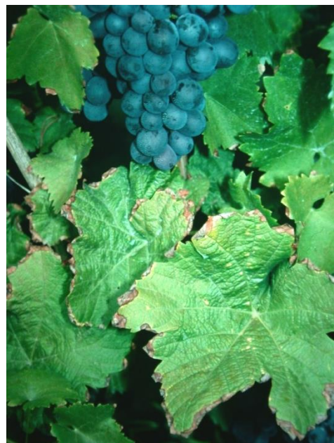
Vertrocknete Blattränder bei Kalimangel.

Die Bodenproben sollen vor einer Grunddüngung aus der Bodenschicht von 0 - 30 cm entnommen werden. Aus 0 - 60 cm Tiefe wird bei Bodenuntersuchung nach der EUF-Methode oder wenn eine tief wendende Bodenbearbeitung geplant ist entnommen. Wenn die Entwicklung der Nährstoffgehalte langfristig beobachtet werden soll, sollte die gleiche Beprobungstiefe beibehalten werden.